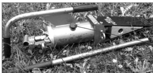
Manche Vis à ailettes Levier